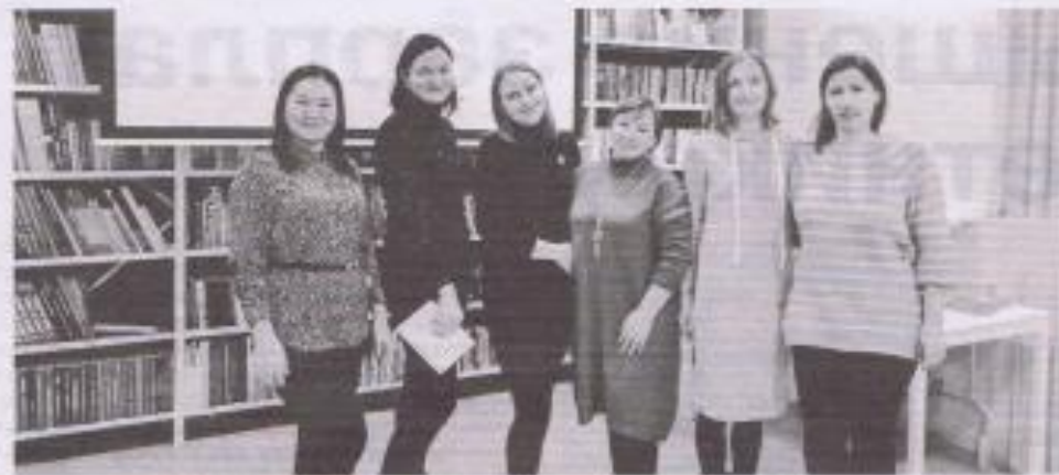
Участники языкового клуба «Никогда не поздно читать на английском».